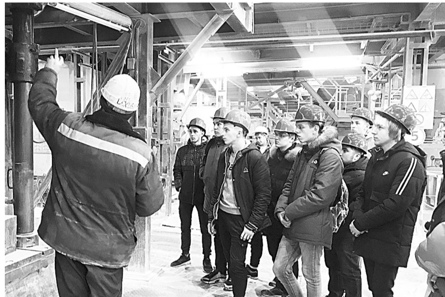
Выпускники Боровичского техникума строительной индустрии и экономики в цехе мелкосерийного производства огнеупорных изделий АО «БКО»