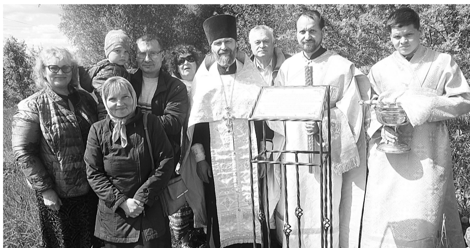
Участники памятного молебна