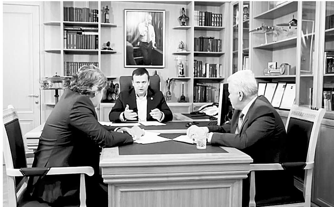
Губернатор Андрей Никитин в программе «Главный эфир» НОТ (скриншот).